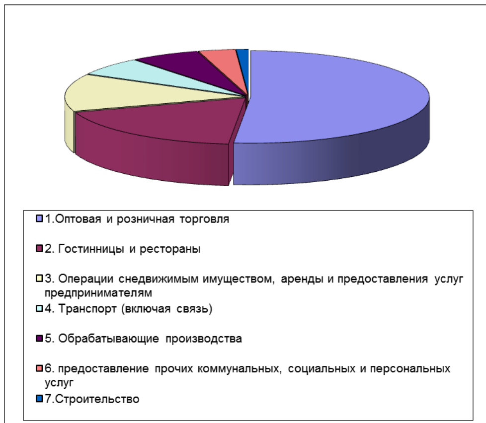
Таблица 2. Структура поступлений денежных средств во все уровни бюджета за 2016 год в разрезе отраслей экономики по индивидуальным предпринимателям.

Анализ поступлений от функционирующих предприятий в предпринимательском секторе городского округа Феодосия по видам экономической деятельности свидетельствует, что наибольшая их часть приходится на оптовую и розничную торговлю – 50,7%, гостиницы и рестораны – 18,1%, сферу операций с недвижимым имуществом, аренды и предоставления услуг предпринимателям – 12,8%, транспортная связь – 6,3% , обрабатывающие производства – 6,1%, предоставление прочих коммунальных, социальных и персональных услуг-3,3%, строительство – 1,1%.